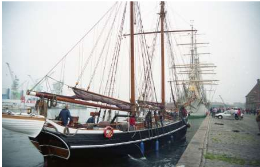
"HALMØ" og skoleskibet "DANMARK" i Nakskov den 19.10.1990.