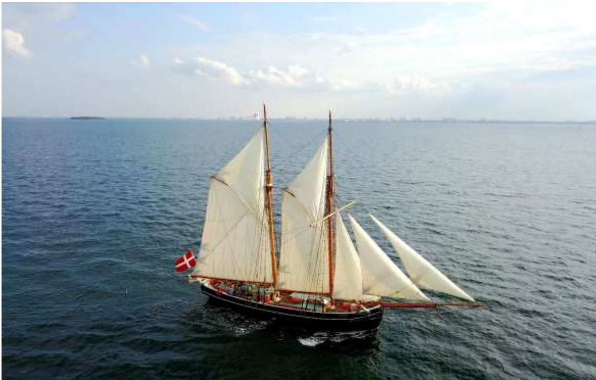
"HALMØ" for fulde sejl.