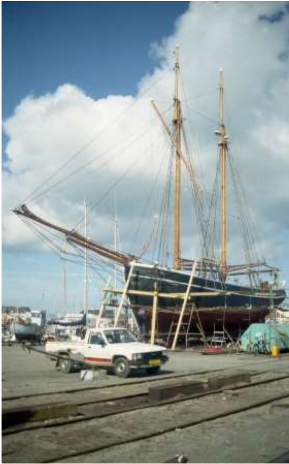
"HALMØ" på bedding i Gilleleje den 13.4.1998.