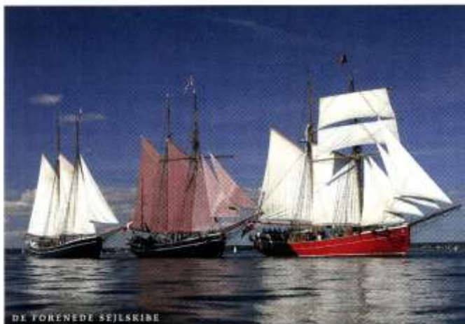
"MIRA" – "HALMØ" – "LILLA DAN"