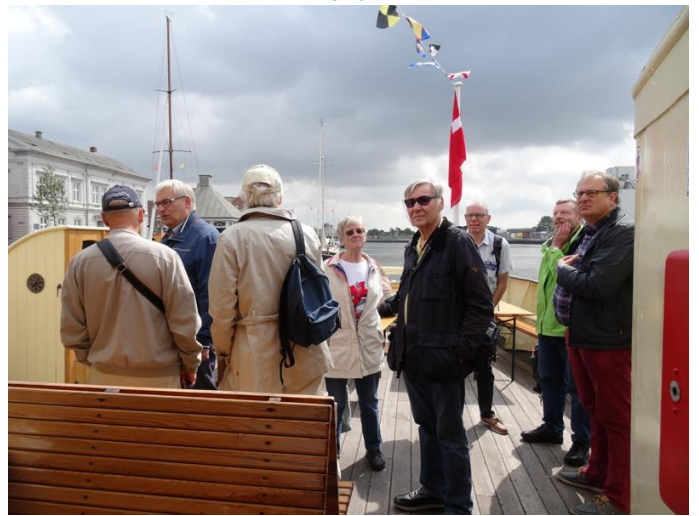
DFHS-deltagere på bildækket på "MØN"