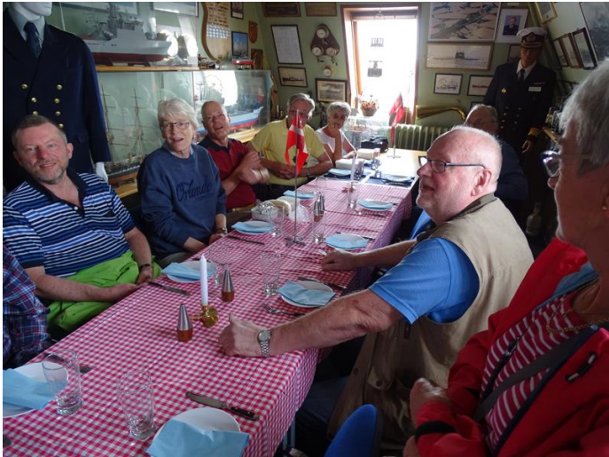
Frokostbordet er dækket i Marinestuen i Nakskov

05/08/2016