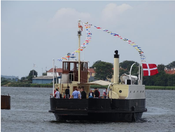
"MØN" returnerer til Nakskov efter turen kl. 13:00